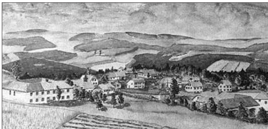
Foto z kapličky na Pošláku