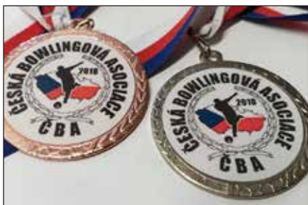
Mistrovství regionu jižní Čechy: 2. místo v kat. 165 – L. Staněk, 3. místo v kat. 190 – L. Staněk

Seďm statečných, bowlingové koule, deset kuželek a nekonečná dráha. Ať už se jedná o hru jednotlivců nebo celého týmu, vždy jde