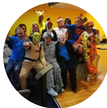
Poslední turnaj r. 2018: Campus Č. B.

Přejeme celému týmu mnoho dalších úspěchů návrat do třetí ligy a děkujeme manželkám, manželům, přítelkyním a rodinám za podporu. Bez toho to prostě nejde. ■