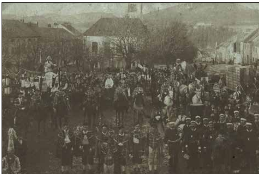
Masopustní průvod v horní části náměstí (počátek 20. století)

Nejveseleji však o masopustu bývalo na „bláznivé dny“, které začínaly o poslední masopustní neděli. Téměř v každém vyšebrodském domě se předtím zabíjel dobře vykrmený vepř a hospodyně vybíraly z truhem uschované zásoby.