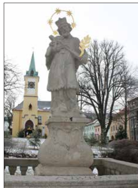
Jan Nepomucký – náměstí.