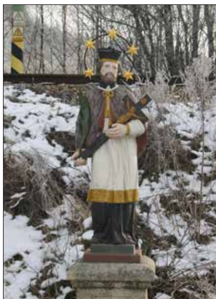
Jan Nepomucký – silniční most v Herbertově.