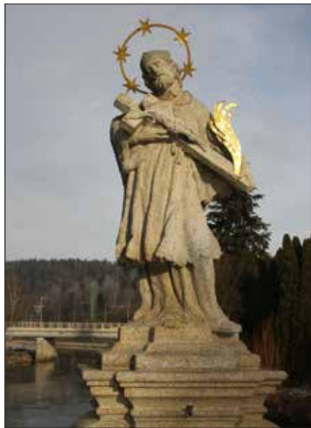
Jan Nepomucký – lávka přes řeku Vltavu.

Svatý Jan Nepomucký, jako rodák z Nepomuku, je hlavním patronem jižních Čech, a je také patronem řeky Vltavy, která se stala jeho prvním hrobem. Zřejmě i z těchto důvodů se nachází ve Vyšším Brodě hned několik jeho soch.