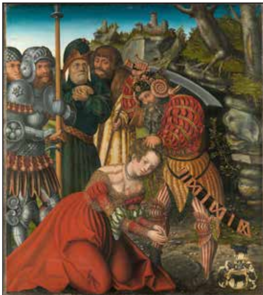
sv. Barbora. Lucas Cranach st., Metropolitní muzeum umění v New Yorku

Svatá Barbora se narodila pravděpodobně ve 3. století ve městě Nikomédii (dnešní Izmit v Turecku) jižně od Istanbulu. Její otec byl snad šlechtic, nebo bohatý kupec jménem Dioskur. Byl to pohan a vyznavač helénistické kultury. Aby ochránil svoji jedinou dceru před silícím vlivem křesťanství, které se sem šířilo z území dnešního Izraele, nechal pro ni vystavět věž, do které by se nikdo nedostal. Barbora se ale seznámila skrz služebné s křesťanskou vírou a tak si do své věže nechala prolomit tři okna jako symbol trojjediného Boha (tedy Nejsvětější Trojice). Barbora nakonec přijala také křest a zaslíbila se Kristu. Když jí otec chtěl výhodně provdat, dcera se mu přiznala ke své víře a prohlásila, že jejím jediným ženichem je Kristus. Otce to velmi zasáhlo a chtěl dceru potrestat. Barbora však utekla a úkryt našla ve skalní tr-