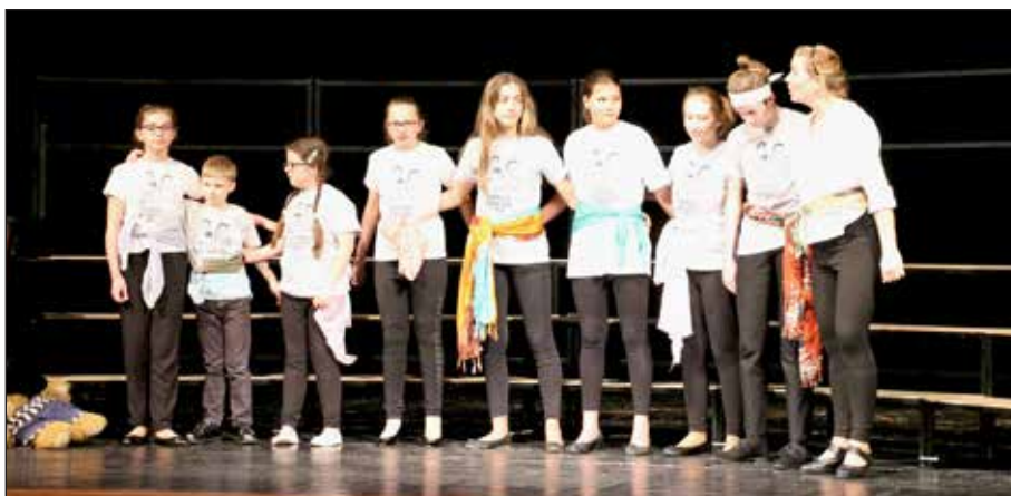
ZUŠ – sbor

Talentedé průzkumy proběhnou v mateřské školce na začátku měsíce května. Rodiče žáků, kteří mají od příštího září zájem studovat v ZUŠ – věnujte, prosím, pozornost informacím v MŠ. V případě, že bude Vaše dítě vybráno a budete mít zájem o studium v ZUŠ, přihlaste dítě elektronicky na stránkách školy do 17. 5. 2019. Pro děti, které se průzkumu nemohly zúčastnit a pro zájemce z okolních obcí budou probíhat odpolední talentové průzkumy 4. 6. od 15.00