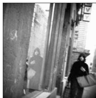
Výstava Praha objektivem tajné policie Červen, po-pá, 8-17 hod., Vestibul kina