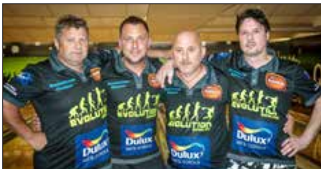
Tým Chvojkovice Vyšší Brod a pohár za první místo ve 4. lize, který katapultoval o ligu výš.

Nervozita stříkala každým pórem. Jiné prostředí, 18 drah a 120 hráčů. Dobrá nálada a bojovnost nechyběla, ovšem rozhodli zkušenosti a chybělo i trochu štěstí. Zásluhou týmové spolupráce byl však výsledek velice příznivý. V konečném pořadí obsadili kluci 32. místo.