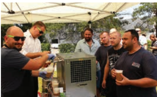
Nealkoholické pivo teklo proudem