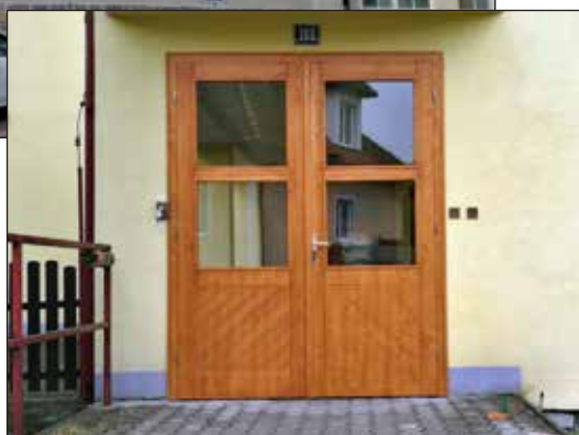
Výměny všech vchodových dveří se dočkala budova domova s pečovatelskou službou.