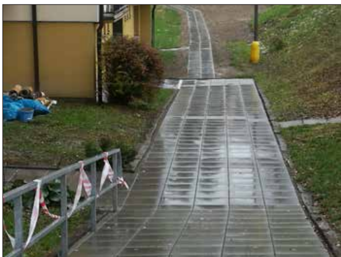
Nový chodník a zábradlí na sídlišti.