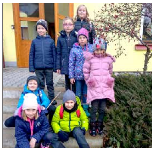
Žáci I. stupně ZŠ v DPS.