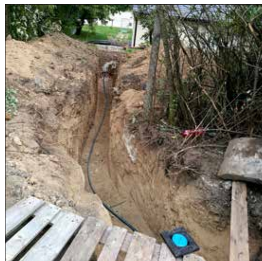
1,4 mil. Kč investovalo město do opravy rozvodů vody ve Studánkách.