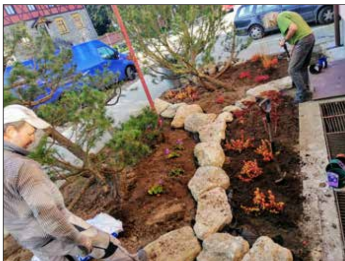
Úprava zeleně. Na podzim provedli odborníci úpravu prostoru před městským úřadem. Upravili a osázeli i náves v Těchorazi.