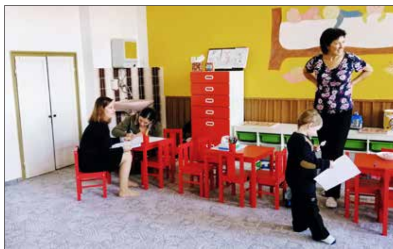
V druhé polovině roku jsme připravili prostory pro dětskou skupinu. 18. 11. proběhl zápis. Na zařízení i provoz má město příslibenou dotaci.