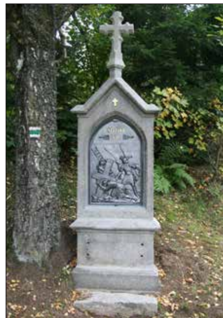
Pokračujeme s opravou křížové cesty, letos VII. a VIII. zastavením za 120 tis. Kč. Získali jsme dotaci od Ministerstva kultury 75 tis. Kč.