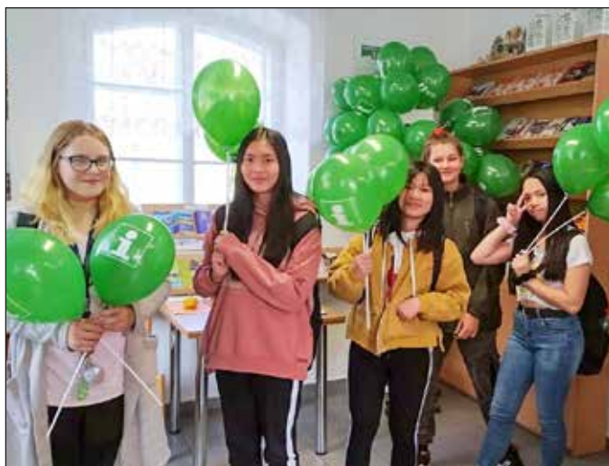
Den infocenter, 24.11.2019.