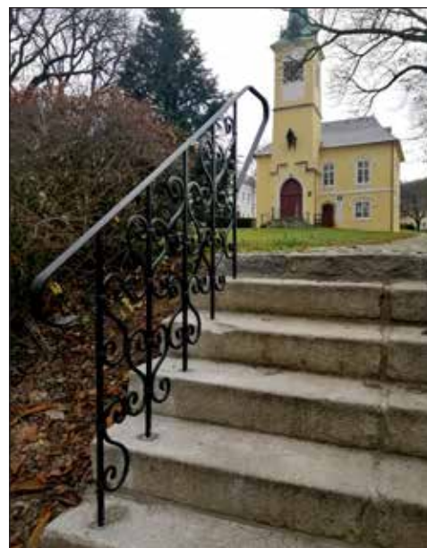
Pro lepší schůdnost přibýlo zábradlí v parku.