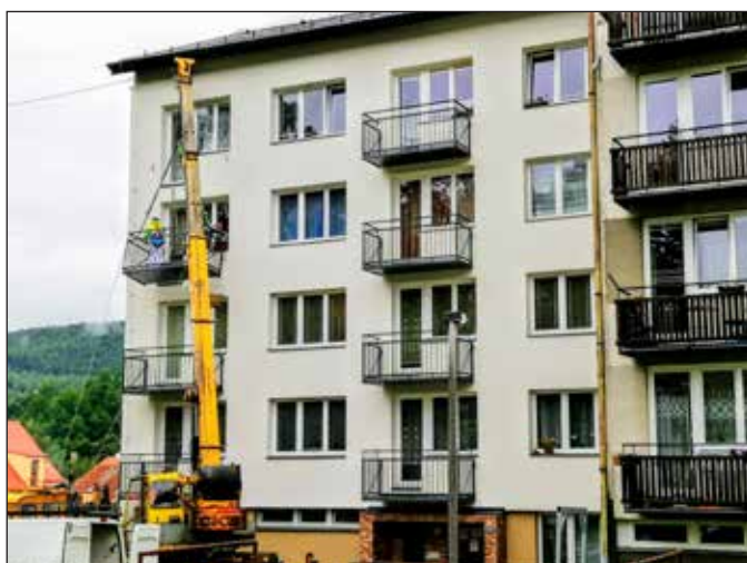
Je zateplen další bytový dům města. Zateplit zbývají už jen dva, které jsou v plánu v roce 2020.