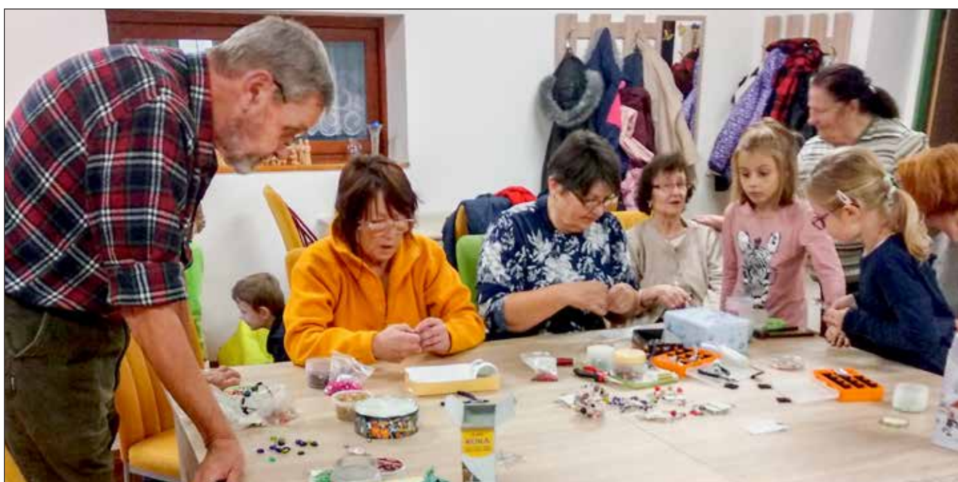
Společné setkání dětí a seniorů při výrobě vánočních ozdob.