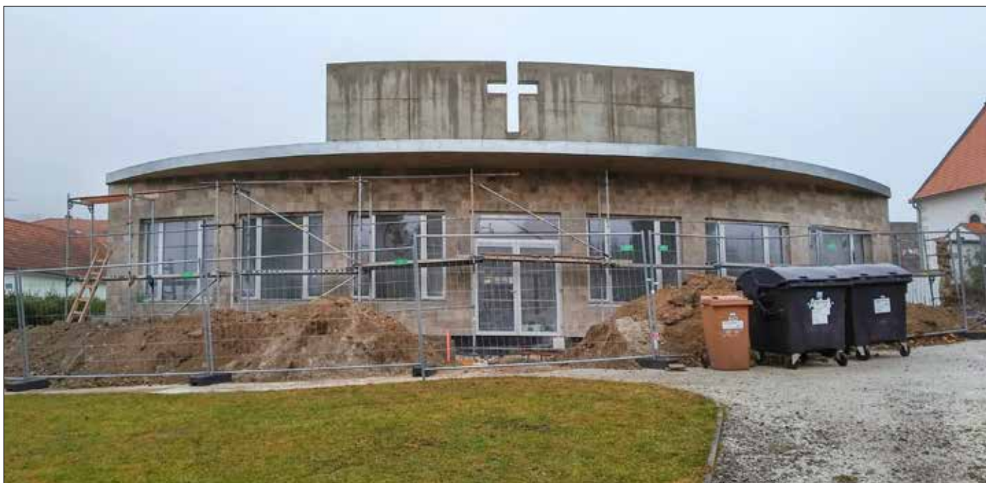
Největší investicí je smuteční síň, stavba stále probíhá. Léta se po nové volalo. Pokračujeme v projektu minulého zastupitelstva, který odstartoval schválením projektové dokumentace v roce 2016. Rozpočtováno je téměř 16 mil. Kč.: