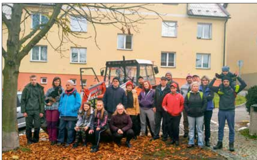
Čištění a zamykání turistických stezek.