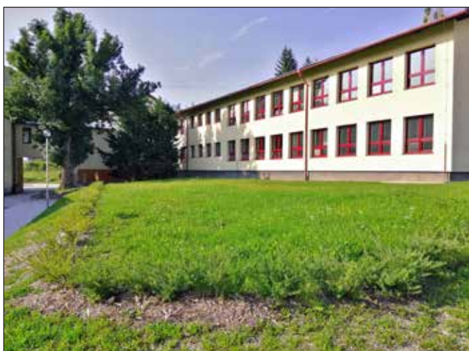
„Nový“ pavilon ZŠ má od léta zateplený spojovací krček a vyměněna okna, celkem za víc jak 2,5 mil.