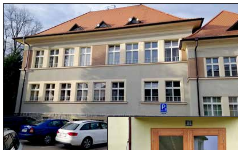
Oprava fasád a výměna oken na staré škole se povedla. S pětimilionovou investicí pomohla dotace Ministerstva kultury téměř 1,8 mil. Kč.