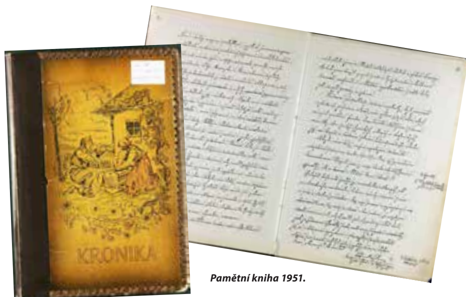
Pamětní kniha 1951.