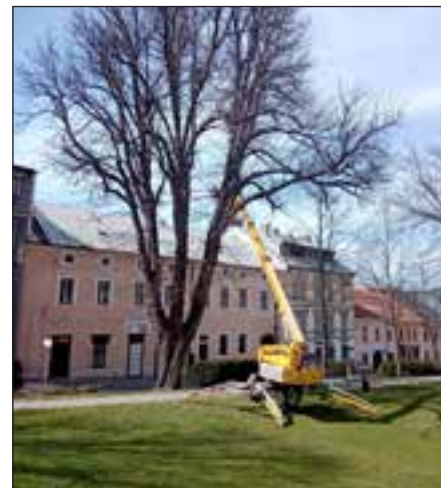
U některých stromů byla obnovena bezpečnostní vazba.

na centrální část parku v okolí vltavského kamene. Proběhne obnova skalky a úprava jejího okolí. V současné chvíli se pracuje na návrzích úpravy a obnovy výsadby květin v dalších částech parku. ■