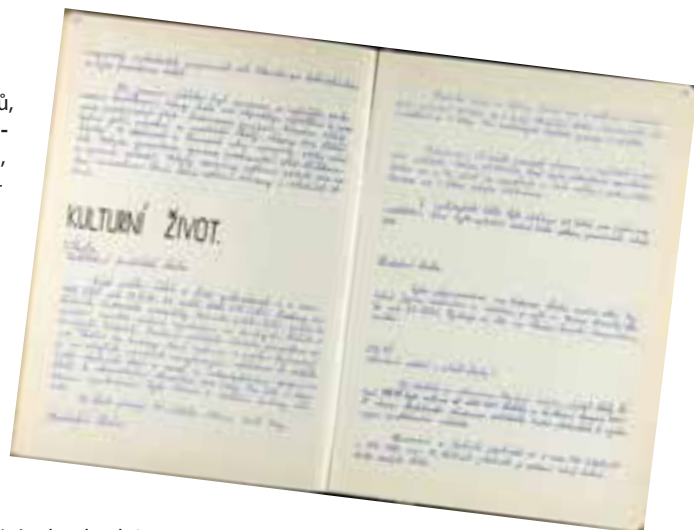
Obecní kronika r. 1961

Obecní kroniky a jejich přílohy by se časem měly postoupit archivu k jejich následné archivaci. Na obci tak zpravidla zůstávají zápisy a přílohy kroniky za posledních 10 let. Kroniky a přílohy se poté archivují ve Státním okresním archivu v Českém Krumlově. Zde jsou zápisy kroniky a fotografické přílohy skenovány a v elektronické podobě následně předány městu. Vlastní knihy jsou pak zpřístupněny zájemcům. Naskenované stránky kronik byly zájemcům k dispozici na stránkách archivů do doby, než vešlo v platnost Obecné nařízení o ochraně osobních údajů Evropské unie. Poté zůstaly k nahlédnutí jen zápisy starší 70 let. Na stránkách Českokrumlovského archivu tak pod kapitolou kroniky můžete shlédnout pouze Pamětní knihu Vyšší Brod 1878–1937 psanou v němčině.