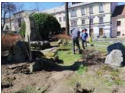
Úprava skalek pro výsadbu v centrální části parku.