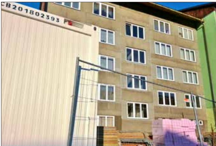
Právě probíhá zateplení bytového domu č. p. 263 v ulici Míru. Celkové náklady na akci budou necelé 3,340.000 Kč s DPH. Město obdrželo rozhodnutí o přidělení dotace na 2,200.000 Kč.

Ještě před vypuknutím všech omezení proběhlo elektronické výběrové řízení veřejné zakázky na „zateplení“ panelového domu v ulici Míru (č. p. 263). O tuto veřejnou zakázku projevil zájem pět společností, které se svými nabídkami přihlášily do výběrového řízení. Nejvhodnější nabídku podala firma EUbuiliding, která výběrové řízení vyhrála s cenou něco