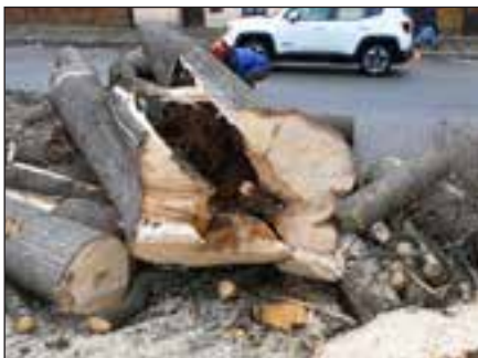
Rozsah poškození lip byl skutečně vážný.

Odbor životního prostředí letos plánuje i obnovu květinové výsadby, tentokrát se zaměřil