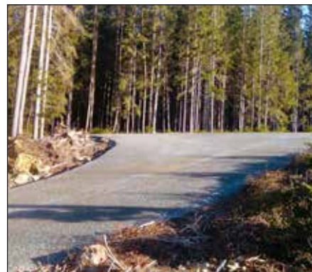
jstr Lesní cesta Radvanov.

Od začátku současného volebního období se podařila vytvořit a dotáhnout celá řada projektů a zvelebit nebo obnovit majetek města. Do rozpočtu jednotlivých let se dostala obnova veřejných prostranství, komunikací nebo památek. Vznikla nová smuteční síň nebo nové zázemí v objektech školy a pro dětskou skupinu. Část úspěšných realizací shrnuje následná fotogalerie. V příštím vydání zveřejníme ještě další z nich. ■