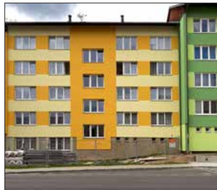
Zateplení bytového domu čp. 263.