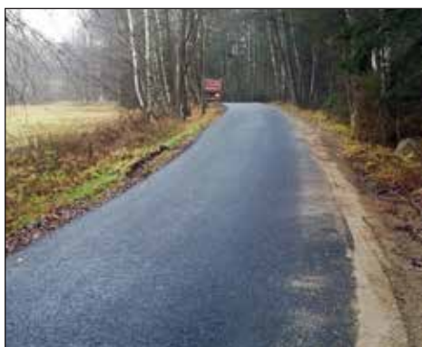
Cesta Lachovice, I. etapa, 2018.