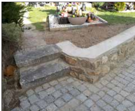
Nový chodník a opěrná zídka na hřbitově, duben 2020.