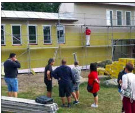
Zateplení krčku a výměna oken v ZŠ, 2019.