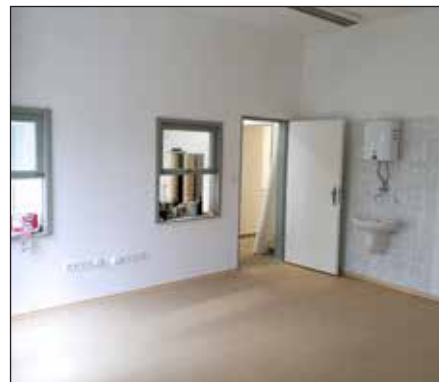
Rekonstrukce čp. 200, 2019.