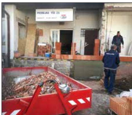
Rekonstrukce čp. 200, 2019.