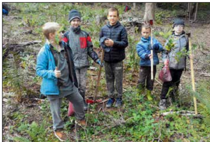
Sázení stromků v lese.