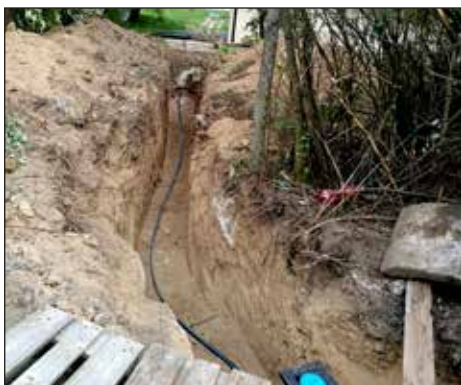
Rekonstrukce vodovodu Studánky, 2019.