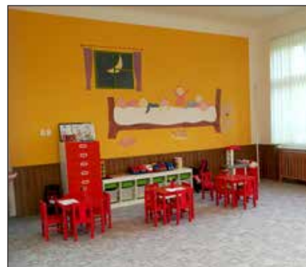
Úprava 1. patra bývalé školy pro potřeby dětské skupiny.