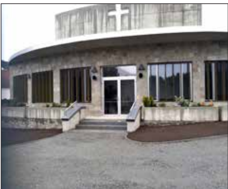
Výstavba smuteční síně, 2019.