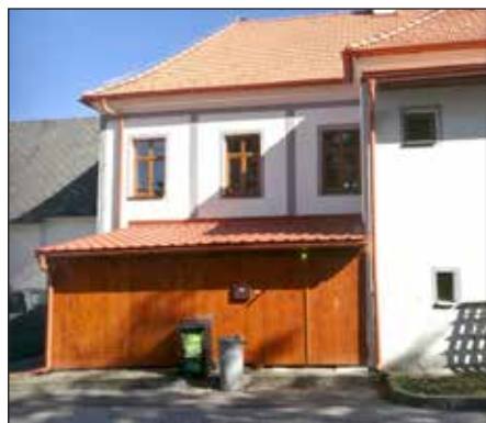
Oprava zázemí a výměna dveří „u kaple“ ve Studánkách.