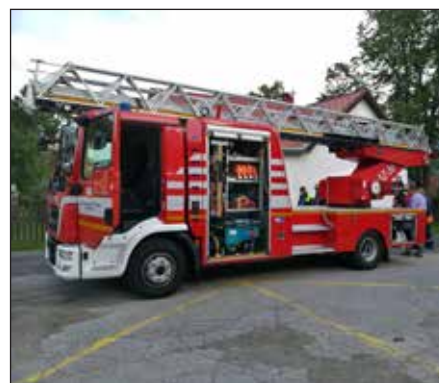
Hasičský žebřík, červen 2020.