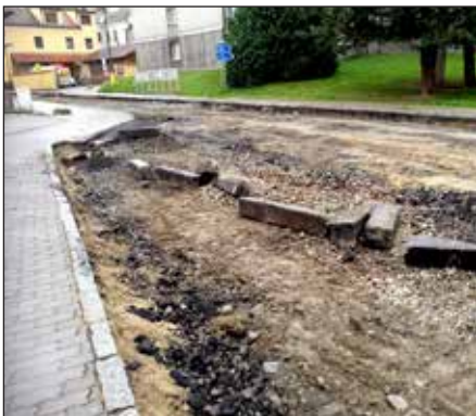
Rekonstrukce komunikace II - 163, 2019.