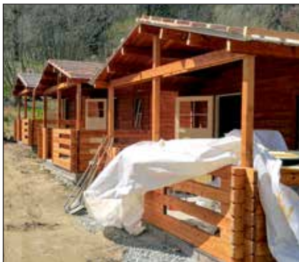
Stavba nových chatek v kempu, 2019.