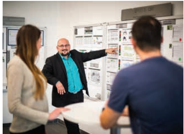
Zástupci oddělení kvality firmy ENGEL