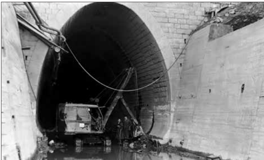
Vyústění odpadního tunelu u Vyššího Brodu.

První polovina roku 1954 je je v celé historii lipenské stavby nejméně dokumentačně zachycena. Neplnil se plán, který vůbec nepočítal se šumavskou zimou. A ta se ukázala v roce 1954 ve své plné krutosti. Mráz, spousta sněhu a fujavice. Dále došel přísun kulaků, živnostníků, intelektuálů a dalších „protisocialistických živlů“. Barabové v té době vydělávali až osmnáct korun za hodinu. Byly to velké peníze, vždyť