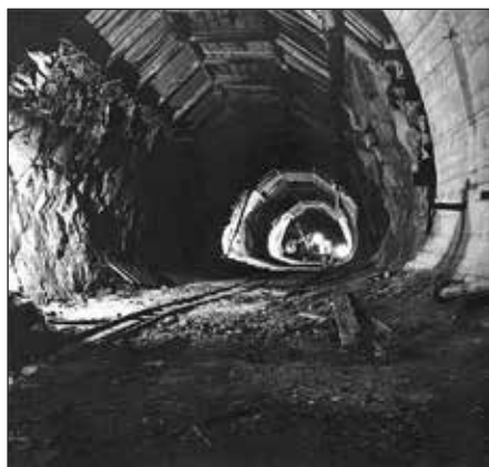
Ražba odpadního tunelu.