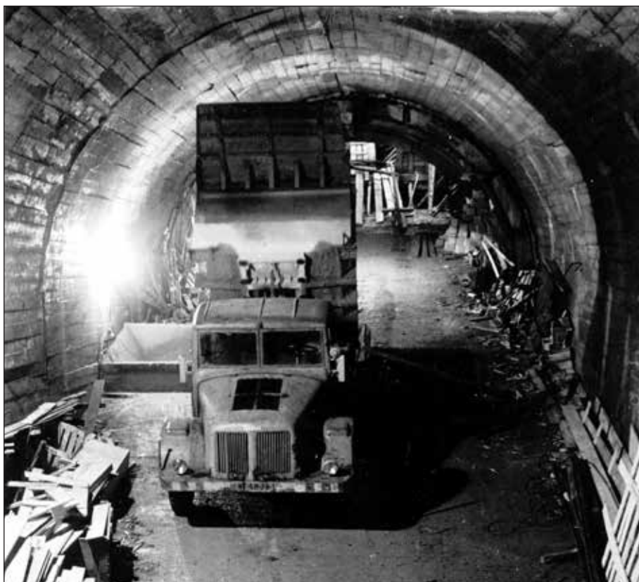
Ražba odpadního tunelu.

Odpadní kanál mezi Vyšším Brodem a podzemní elektrárnou se začal razit 13. května 1952. První slavnostní odstřel provedl tehdejší ministr stavebnictví Emanuel Šlechta. Počátky tunelu byly velmi svízelné. Nebyla mechanizace. Průměrný denní postup byl v roce 1952 půldruhého metru a v následujícím roce 1953 se dosáhlo zhruba stejného výkonu. Opoždění bylo i v roce 1954, kdy průměrný denní výkon byl 2,72 metru. V roce 1952 se na tomto odpadním tunelu od Vyššího Brodu pracovalo pouze s pneumatickými vrtačkami „na sucho“, kdy každý trpěl vdechováním žulového prachu. Odstřelená žula byla do vozíků nakládána ručně a vyvážena „na barabu“ na břeh Vltavy u začátku budoucího odpadního tunelu. V závěru roku 1954 se zde poprvé objevily automatické nakladače odstřelené žuly. Barabové vždy navrtali tolik děr k odstřelu, že po odstřelu byl tunel o 100 až 110 centimetrů delší. V polovi-