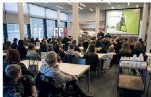
Workshop ZŠ Kaplice v ENGELU