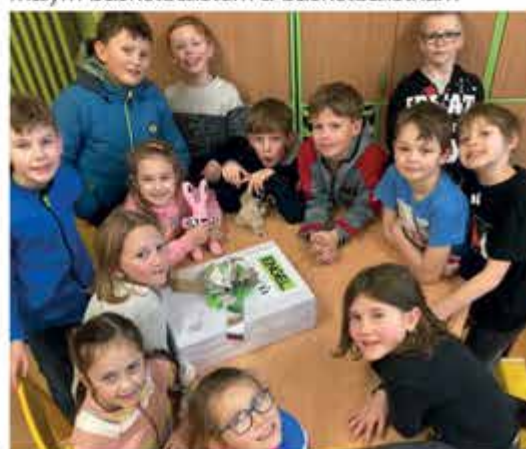
ENGEL dětský den – výtvarné potřeby do školní družiny