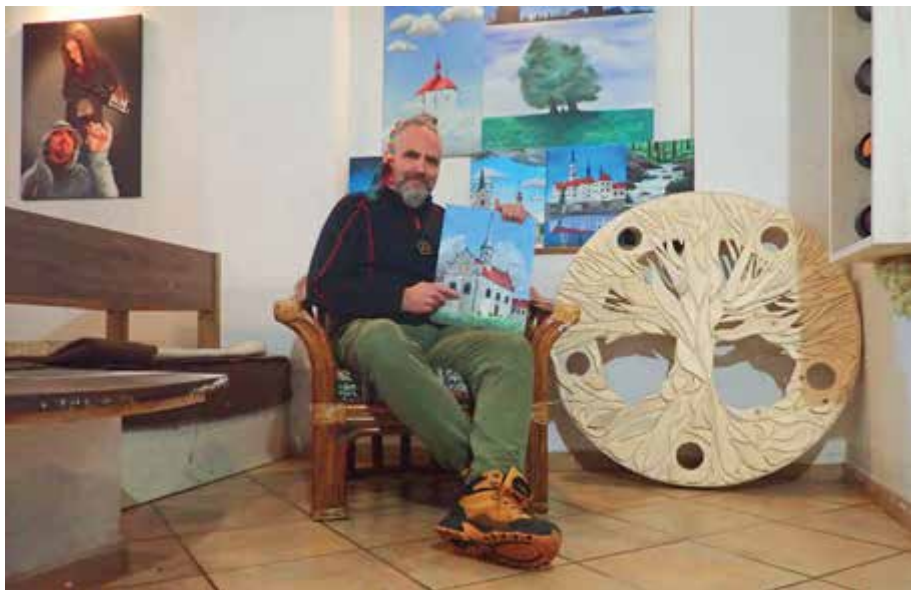
Výtvarník v domácí galerii s malbou vyšebrodského kostelíka sv. Josefa