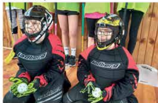
Sportovní den s DRAKIÁDOU – vybavení na florbal a házenou pro školáky