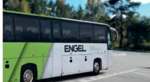
ENGEL BUS – zaplacená doprava pro školáky na kurzy plavání, bruslení a lyžařský kurz