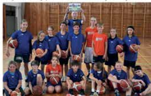
ENGEL v BĚHU – nákup tréninkových triček malým basketbalistům a basketbalistkám