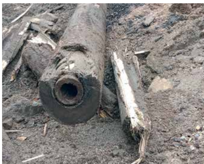
Zajímavostí, kterou jste mohli zaznamenat v této etapě, je vyzvednutí částí dřevěného vodovodu neurčitého stáří. Části jsou uloženy pro případný sbírkový fond budoucího městského muzea.