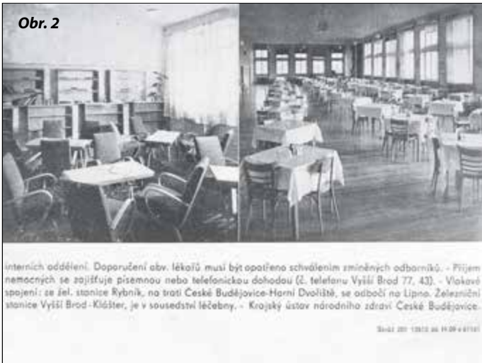
Obr. 2 interních oddělení. Doporučení obr. lékařů musí být opatřeno schválením zmíněných odborníků. - Příjem nemocných se zajišťuje písemnou nebo telefonickou dohodou (č. telefonu Vyšší Brod 77. 43). - Vlakové spojení: ze žel. stanice Rybník, na trati České Budějovice-Horní Dvořiště, se odbočí na Lipno. Železniční stanice Vyšší Brod-Klášter, je v sousedství léčebny. - Krajský ústřední národního zdraví České Budějovice.