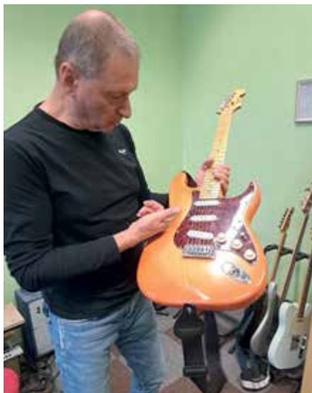
Tuto kytaru jsem vyrobil jako druhou v pořadí.

„Vždycky má na veřejnosti úspěch kapela, která má všechno ošetřené, řádně nacvičené a zní co nejvíc dokonale. Aby kapela dobře fungovala, tak nejen, že musím umět dobře hrát, ale měla by mít slušné vybavení, protože teprve kvalitní zvuk udělá kapelu na úrovni. Hudba je