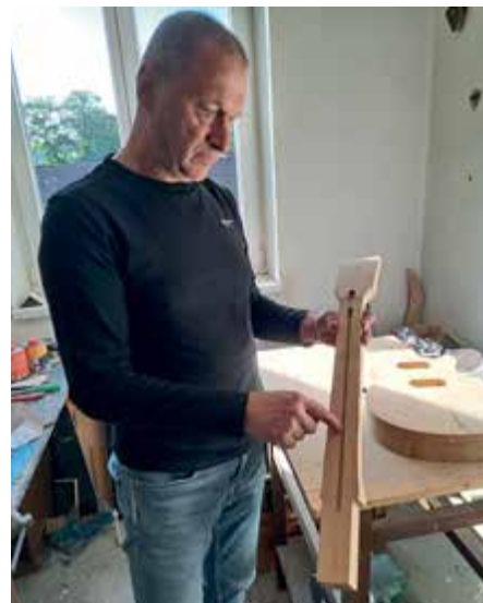
Javorový krk a jasanové tělo z masívu.

„Já jsem zjistil v průběhu těch let, že se mi vždy líbila kytara jako nástroj. Když vidím nějakou pěknou kytaru, kochám se pohledem, vzbuzuje to ve mně pozitivní emoce. Jeden můj kamarád v Černé v Pošumaví začal stavět elektrické kytary. Viděl jsem, jak to dělá a začalo mně to lákat, že bych si taky nějakou vyrobil. Vycítil jsem zvláštní pokušení. Když má člověk vysušená správná prkna, opracovává trpělivě dřevo, dostane výtvar do nějakého tvaru a do