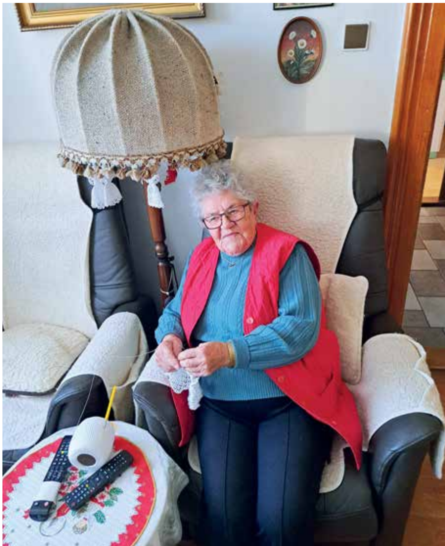
Při háčkování andělů.

válce třeba, a jelikož byl odsun dále zastaven, proto jsme nakonec mohli zůstat. Byli jsme jako Němci obklopeni příchozími obyvateli bez domova, nebo těmi, co byli vyzváni českou poválečnou vládou k obydlení pohraničních oblastí. Žili tady a pracovali pospolu Němci, Cikáni, Maďaři, Rumuni a Slováci. Český správce tehdejšího hospodářského družstva nás všechny nazýval ksindlem. Hodně přicházeli ti bez střechy nad hlavou, z chudého kraje pod příslibem, že dostanou baráky pro rodinu. Ale nebylo to tady jednoduché, byl to tvrdý život.“