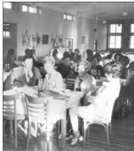
Obrázek č. 3 Velký sál ústavní jídelny se využíval ke společenským akcím. Asi 70. léta 20. století.