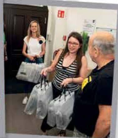
Chráněné bydlení Kaplice