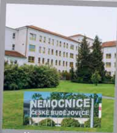
Hematoonkologie nemocnice Č. Budějovice