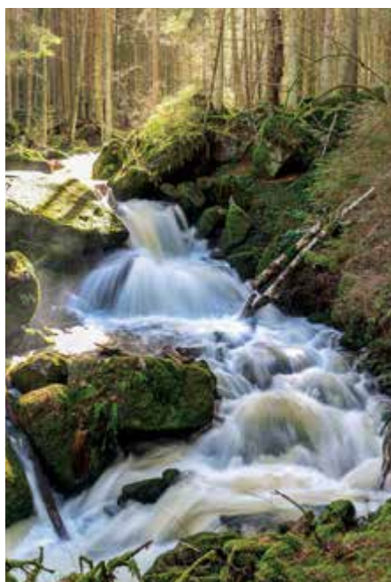
Vítězný snímek Bohumila Candry: „Vodopády svatého Wolfganga.“