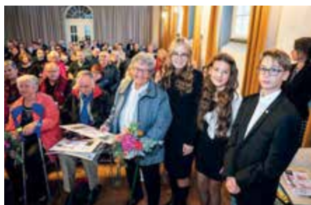
Setkání v českokrumlovské synagoze v rámci projektu Příběhy našich sousedů.

Skončili jsme nakonec v Přísahově, kde jsme museli zůstat na práci. Každé ruky bylo po