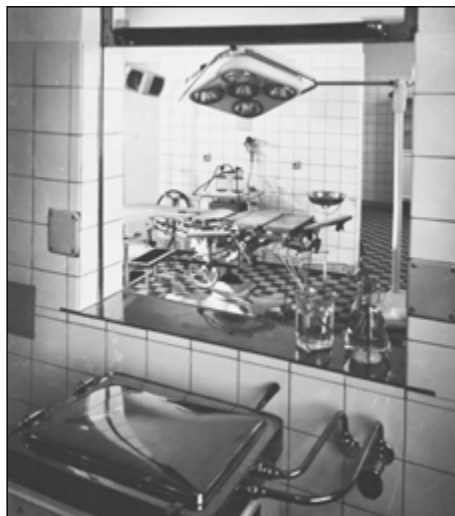
Obrázek č. 1 Pohled do operačního sálu léčebny. Příloha kroniky obce, rok 1984.