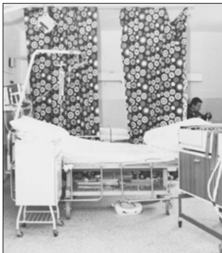
Obrázek č. 2 Zařízení pokoje intenzivní péče.