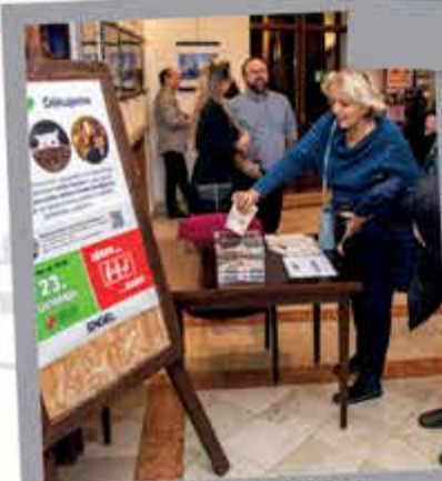
Útulek pro kočky města České Budějovice