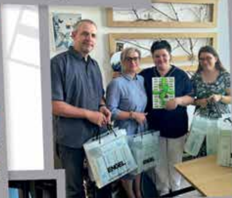
Domov pro seniory Kaplice