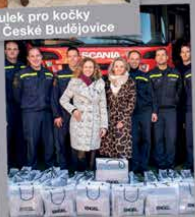
profesionální hasiči Kaplice