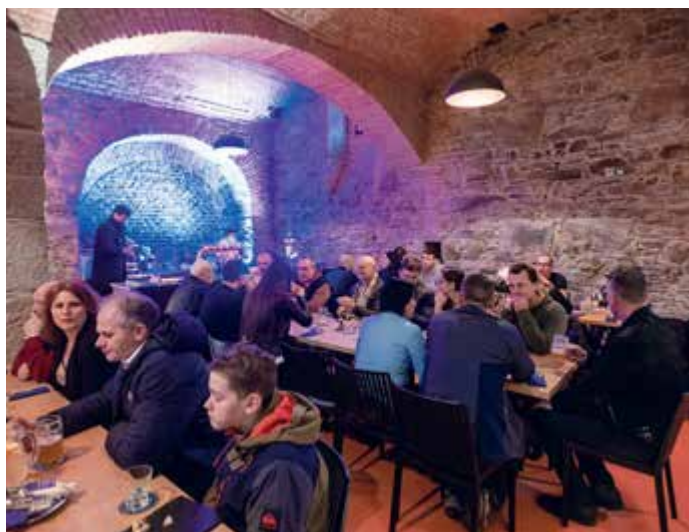
Společenského setkání se účastnili i zástupci okolních měst a obcí.