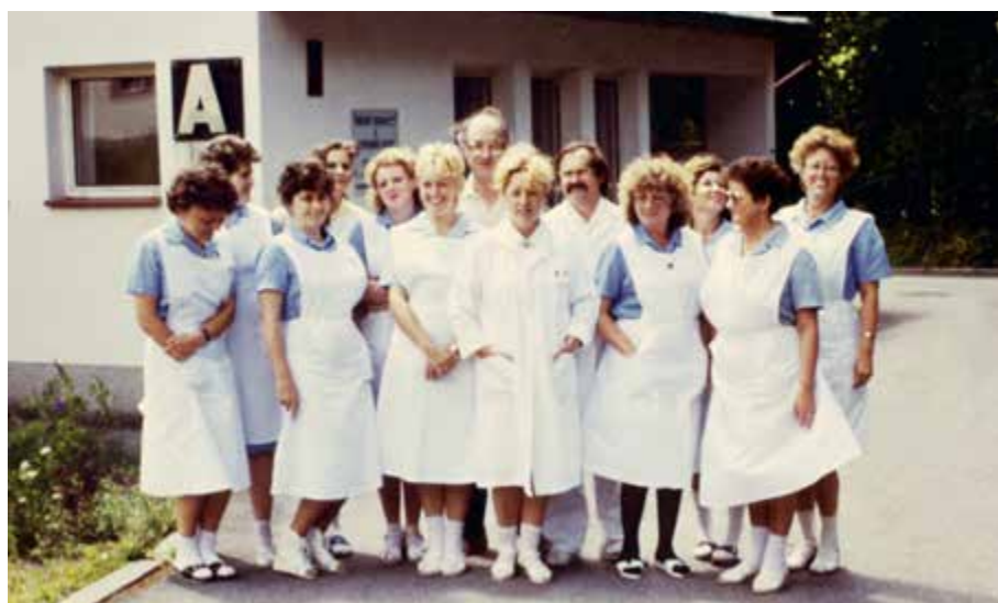
Obrázek č. 2 – Jedna z posledních společných fotografií zaměstnanců oddělení TRN před ukončením provozu léčebny na Hrudkově.

pacientů a jejich příbuzných poněkud složitá. Návštěvy za nimi musely komplikovaně dojíždět z Českých Budějovic na Hrudkov veřejnou dopravou nebo vlastními vozidly. Tento neblahý stav si vedení českobudějovické nemocnice uvědomovalo, a tak v roce 1986 vznikla další dvě oddělení léčebny dlouhodobě nemocných přímo v Českých Budějovicích. Stav se zdál být uspokojivý, neboť se také celková nabídka lůžek LDN více jak zdvojnásobila. Jak se ale následně ukázalo, situace se tím nevyřešila. Nejen pacienti, ale především jejich příbuzní, naléhali na personál akutních oddělení a požadovali umístění v LDN v Českých Budějovicích, a nikoli ve vzdálené příhraniční obci. Dvě českobudějovická oddělení však nebyla schopna z kapacitních důvodů všechny uspokojit, a tak zprvu byl ten, kdo nenaléhal,