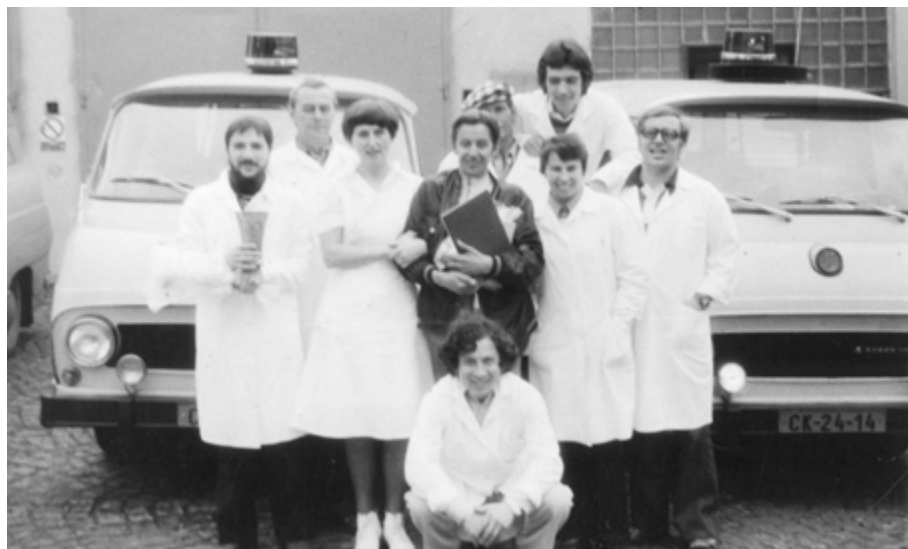
Obrázek č. 1 – Hrudkovská léčebna provozovala od počátku vlastní autopark sanitních vozů.