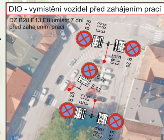
DIO - vymístění vozidel před zahájením prací DZ B28, E13, E8 umístit 7 dní před zahájením prací