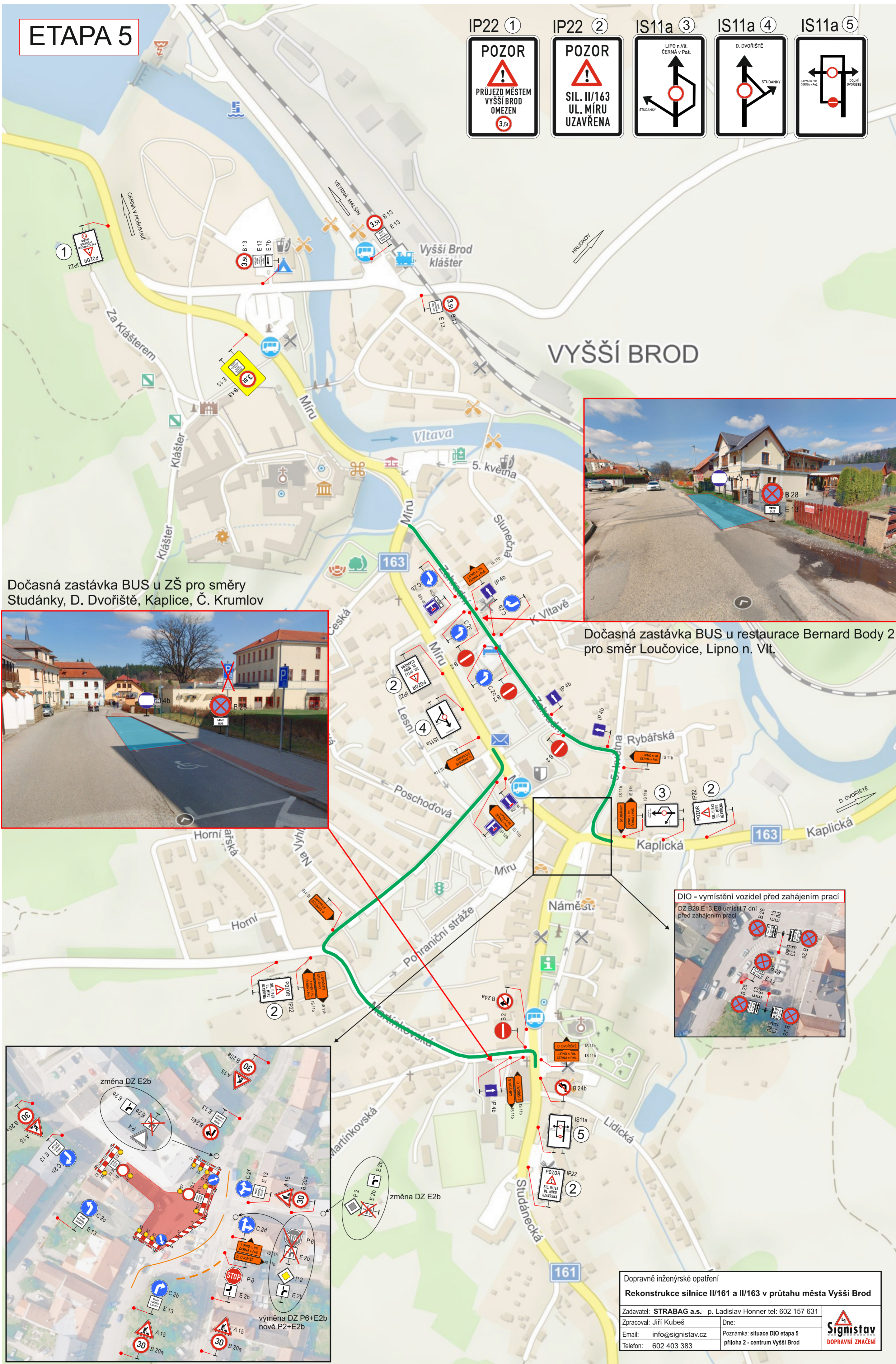
Dočasná zastávka BUS u ZŠ pro směry Studánky, D. Dvořiště, Kaplice, Č. Krumlov